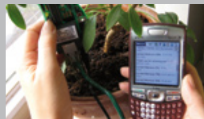
BEI ANRUF: WASSER

Kopfhörer sind eine tolle Sache - wenn sie einem nicht dauernd aus dem Ohr fallen. Für alle, die auf der Suche nach der vollkommenen Passform sind, gibt es für iPod & Co. sogenannte InEar-Kopfhörer. Die besten von ihnen nennen sich REALsound by ReSound™. Sie werden beim Hörgeräteakustiker auf Grundlage individueller Ohrabdrücke gefertigt und führen mit ihrem exzellenten Klang und dem perfekten Tragekomfort seit Jahren die Test-Charts der Referenzklasse an. Wer jedoch mit dem Sound seines Standard-Kopfhörers zufrieden ist, dem kann ein Paar maßgefertigter Adapter der Marke Young REALsound by ReSound zum individuellen Hörglück verhelfen.