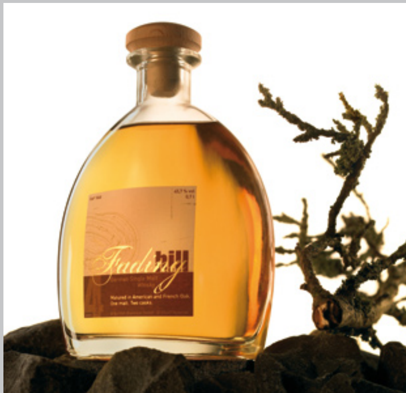
GERMAN WHISKEY? GERMAN WHISKEY!

Papier statt Plastik! Mit dieser handgedrechselten, aus FSC-zertifiziertem Buchenholz gefertigten Presse ist es ein Kinderspiel, aus Altpapier bzw. alten Zeitungen Anzuchttopfe zu basteln. Zudem spart es Geld und schont die Umwelt. Einfach einen Papierstreifen um den Zylinder legen, am Boden umschlagen und in der Presse mit einer Drehbewegung festdrücken. Schon ist der biologisch abbaubare Topf (Ø ca. 4 cm, H ca. 4 cm) fertig für die Aussaat. Ist der Sämling groß genug, wird er, die zarten Wurzeln schonend, mitsamt dem Topf ausgepflanzt, der sich nach kurzer Zeit im Erdreich zersetzt.