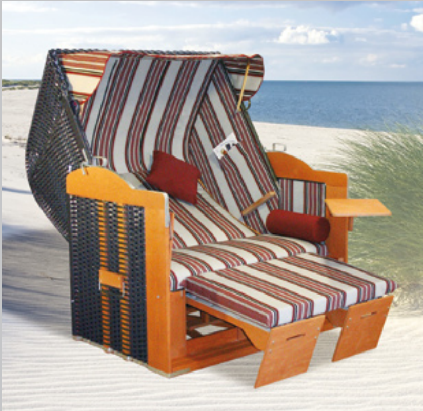
ENTSPANNUNG TYPISCH DEUTSCH

Im Ausland gänzlich unbekannt, gehört er an den hiesigen Nord- und Ostseeküsten zum Strandbild wie Möwe und Eisverkäufer. Er verspricht Schutz vor Wind und Wetter sowie Ruhe vor emsigen Miturlaubern, die sich den Strandabschnitt teilen müssen. Er ist das möblierte Symbol für Privatsphäre und Entspannung. Wer den Strand zu spät aufsucht, wird seine Vorzüge in der Regel nur von außen bezeugen können. Die Rede ist vom Strandkorb. Was liegt zum ausgehenden Sommer näher, als das Strandfeeling nach Hause zu holen und sich seine eigene Bastion der Gemütlichkeit auf die Terrasse oder in den Garten zu stellen? Ob als Singlekorb oder als 2-, 2,5- oder 3-Sitzer, ob im 45°- oder 90°-Winkel neigbar, ob aus Rohrbast, Peddigrohr oder Kunststoff geflochten: Den echten deutschen Strandkorb gibt es in allen erdenklichen Größen, Dimensionen und Farben. Ausstattungsvarianten wie Lektüretasche, schwenkbarer Bistrotisch oder – falls der Nachbar der Versuchung nicht widerstehen kann – das verschließbare Schutzgitter sind auf Wunsch zusätzlich erhältlich. Strandkörbe von Eggers, einem traditionsreichen Familienbetrieb, der seine Wurzeln in der Herstellung von Rohrkörben und Flechtwaren hat, werden direkt ab Werk nach Hause geliefert. Sie sind wetterfest und halten normalerweise ein Leben lang. Das ist deutlich mehr, als man von einem Urlaub erwarten kann.